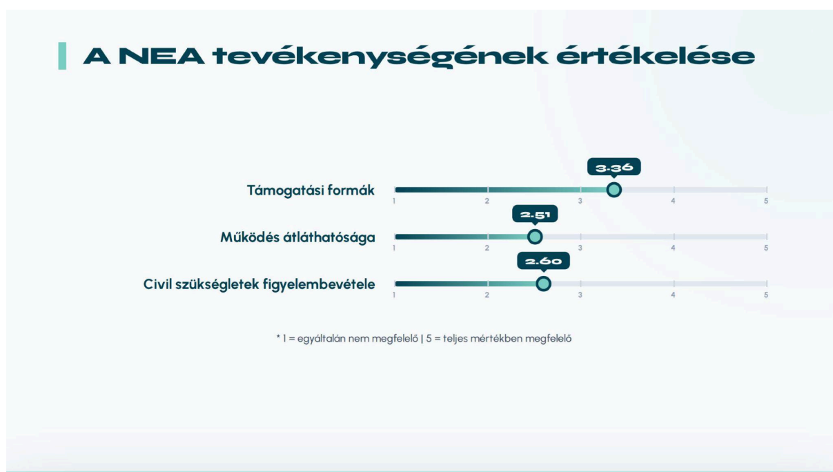
3.ábra. Mennyire megfelelő a NEA tevékenysége az adott területeken? (1-5)

Hasonló a helyzet a civil szektor szükségleteinek figyelembevételét vizsgáló kérdésnél is: a kérdés átlagpontszáma 2,6, a második legalacsonyabb, a válaszadók 49,8%-a vélte úgy, hogy a rendszer egyáltalán nem, vagy nem megfelelő mértékben veszi figyelembe a civil szervezetek valós igényeit, és ezt így gondolta a nyertes szervezetek 40,4%-a is. (3. ábra)